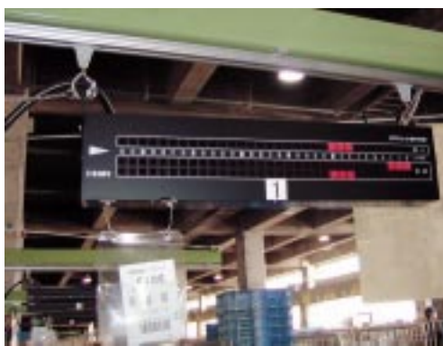
シュート下の店別仕分け表示板