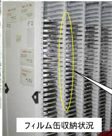
フィルム缶収納状況